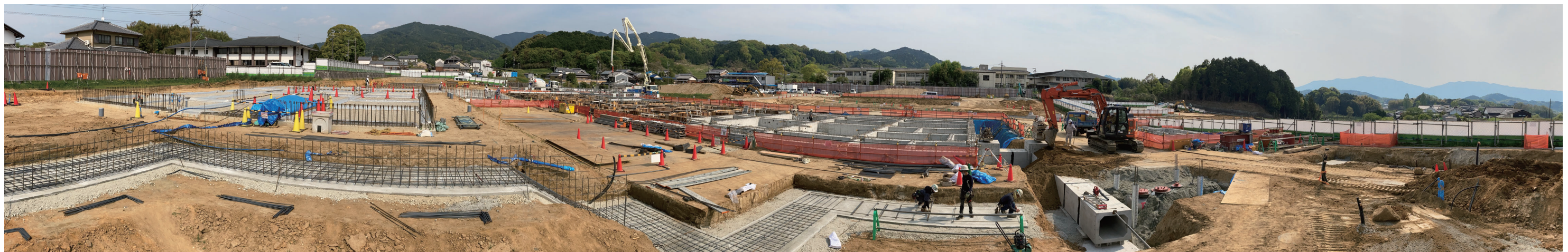
屋外機械置場から撮影