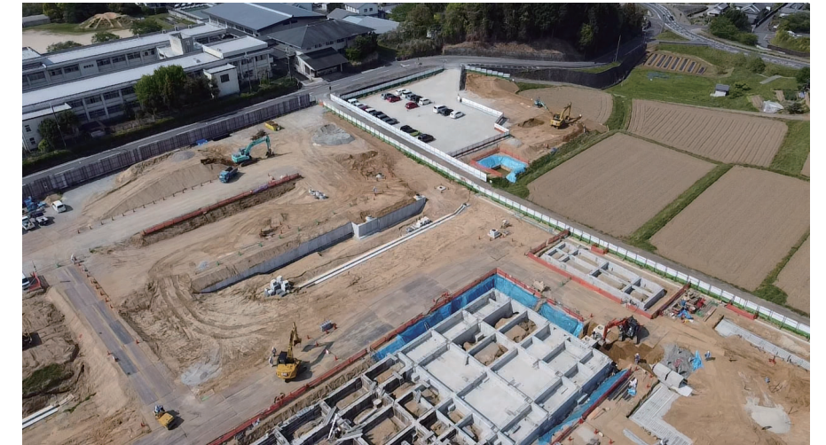
調整池 A B